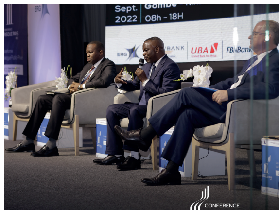
Panel 3 de la 1ère édition, CRP RDC