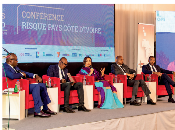
Panel 3 de la 7e édition, CRP CI