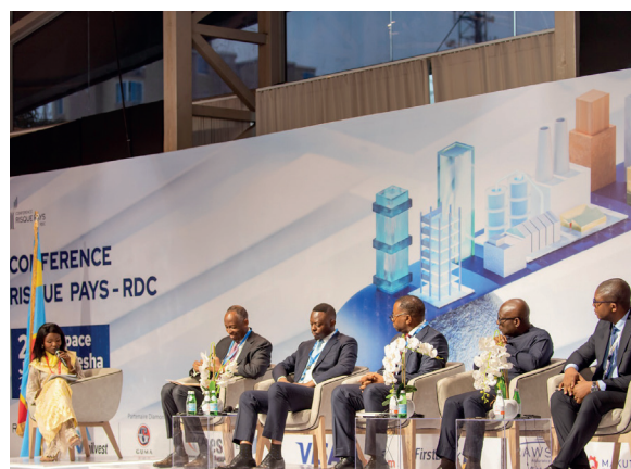
Panel 2 de la 2e édition, CRP RDC