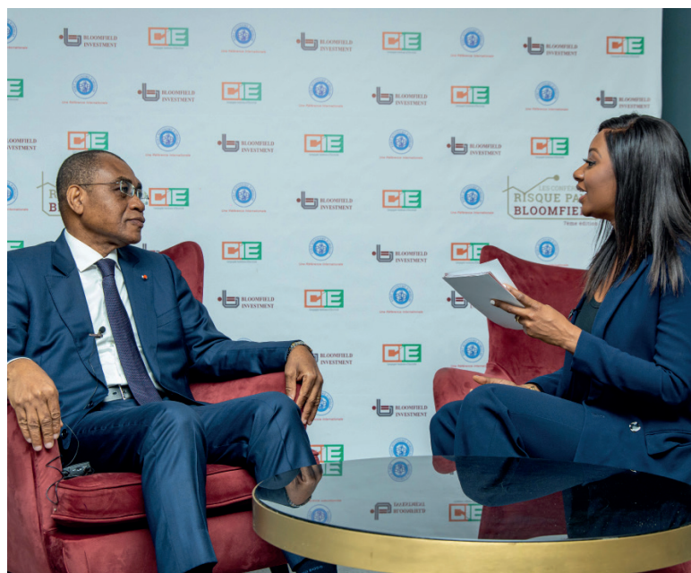
SEM Adama COULIBALY, Ministre des Finances et du Budget, République de Côte d'Ivoire au plateau Tv CRP-CI 2023

La CRP-CI rassemblera des Ministres, des membres du corps diplomatique, des représentants des institutions internationales et des principales institutions financières, des dirigeants de structures publiques, des dirigeants des plus grandes entreprises de la Côte d'Ivoire, des investisseurs locaux et internationaux ainsi que des responsables de multinationales.